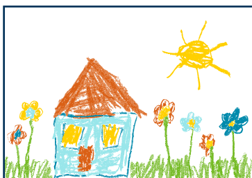
hacer un dibujo