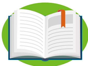
leer un libro