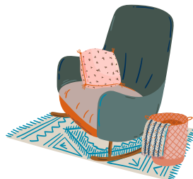
tomar un descanso