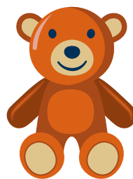
abrazar mi peluche favorito