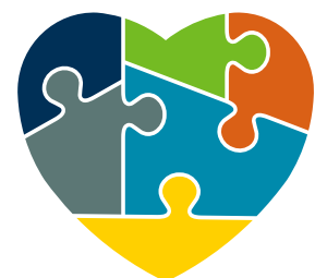
construir un rompecabezas